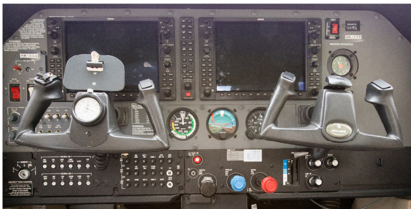
Cockpit der Cessna 182T mit G1000 und GFC 700 (Autopilot)