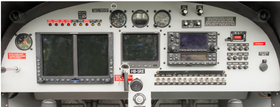
Cockpit der neuen AT3 mit G500 und MPV 50