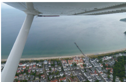
Binz, typischer Ostsee Kur- und Badeort auf Rügen

Von Waren flogen wir weiter auf die Insel Rügen an der Ostsee, ehemals von der DDR als sozialistisch "fürstlich" gepriesener Bade- und Ferienort auf der grössten Insel Deutschlands. Dort mieteten wir ein Auto und genossen es, fast wie Pensionierte die Badeorte auf der Insel zu besuchen und aus Wettergründen die Tee- und Kaffeestuben zu besuchen. Auch liessen wir die