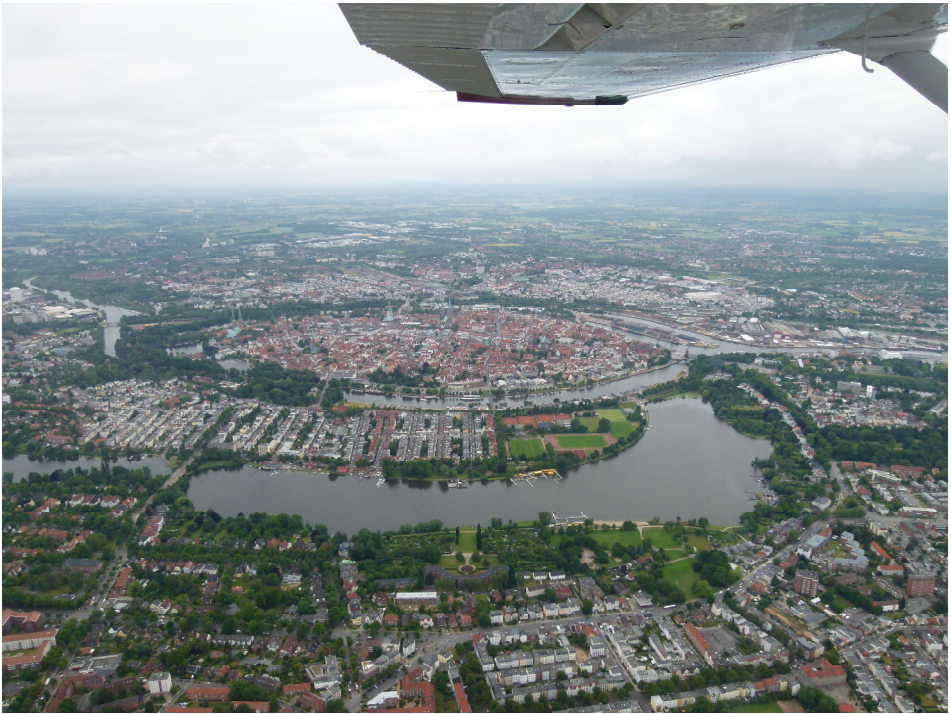
Lübeck, Altstadt inmitten der Wallanlage

Pilotenkollege mit seiner Frau auf die Cessna, um den Weiterflug Richtung Nordkap in Angriff zu nehmen. Da sie von der Schweiz mit dem Auto hierher gefahren waren, war es nur logisch und auch ein Vergnügen mit ihrem Wagen die Heimreise mit weiteren Zwischenstops in Deutschland, diesmal aber auf dem Boden, anzutreten und die sehenswerten Städte wie Lübeck, Wuppertal, Linz am Rhein, Koblenz und Freiburg im Breisgau ausgiebig zu besuchen.