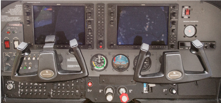
Cockpit der Cessna 172R mit G1000

schen Chef Peter Friedli fast zur Verzweiflung brachte und eine lange Zeit mit Warten bis die HB-TLF via Grenchen die Zulassung erhielt und die FGR die zweite Maschine mit G1000 in Betrieb nehmen konnte! Im Übrigen: die neue Immatrikulierung hat nichts mit Tanklöschfahrzeug zu tun! Der Vorschlag dieser Buchstaben kam seitens des FGR Fluglehrers "JP" (Hanspeter) Wenger, der damit eine leicht zu merkende Kombination von CLF auf TLF einführen liess.